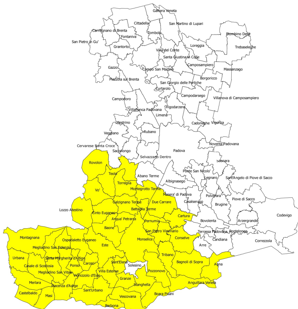
Immagine 1: Area della Provincia di Padova e Ambito Territoriale Designato del GAL Patavino (evidenziato in giallo)

Nella tabella a seguire si riporta l'elenco dei Comuni e le principali caratteristiche di omogeneità dei Comuni ricompresi nell'ATD del GAL Patavino.